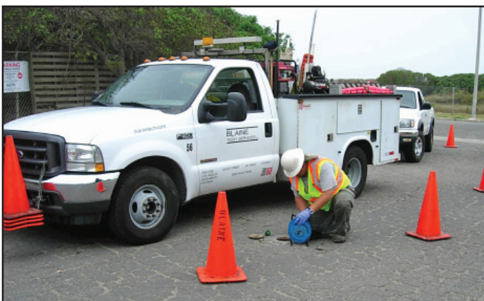
Midiendo el nivel de agua en el sitio Superfund Halaco

En enero del 2008, la EPA entrevisto a 27 miembros de la comunidad sobre su conocimiento del sitio Halaco, sus preocupaciones, y como seria la mejor manera para compartir información sobre el sitio. De acuerdo con estas entrevistas, hemos preparado un Plan de Participación Comunitaria de 29 páginas. El Plan propone actividades de alcance comunitario para fomentar la comunicación entre la EPA y los miembros